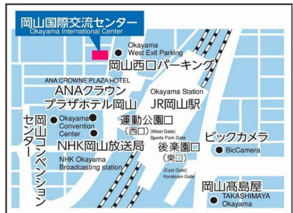
岡山市勤労者福祉センター位置図